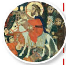
Рисунки Елены Черкасовой