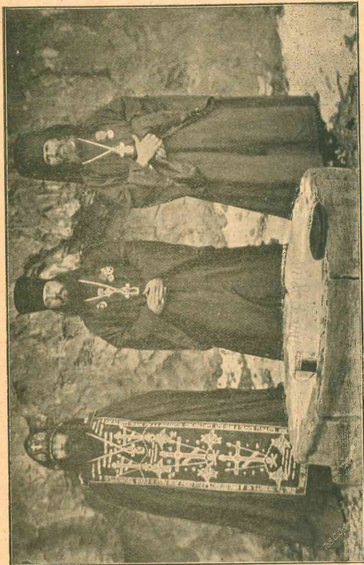
Минеральный источникъ при монастырскихъ пещерахъ.

1897 г. октября 2 дня съ вечернимъ поѣздомъ на ст. Кавказскую изъ Ставрополя изволилъ прибыть Его Прео-